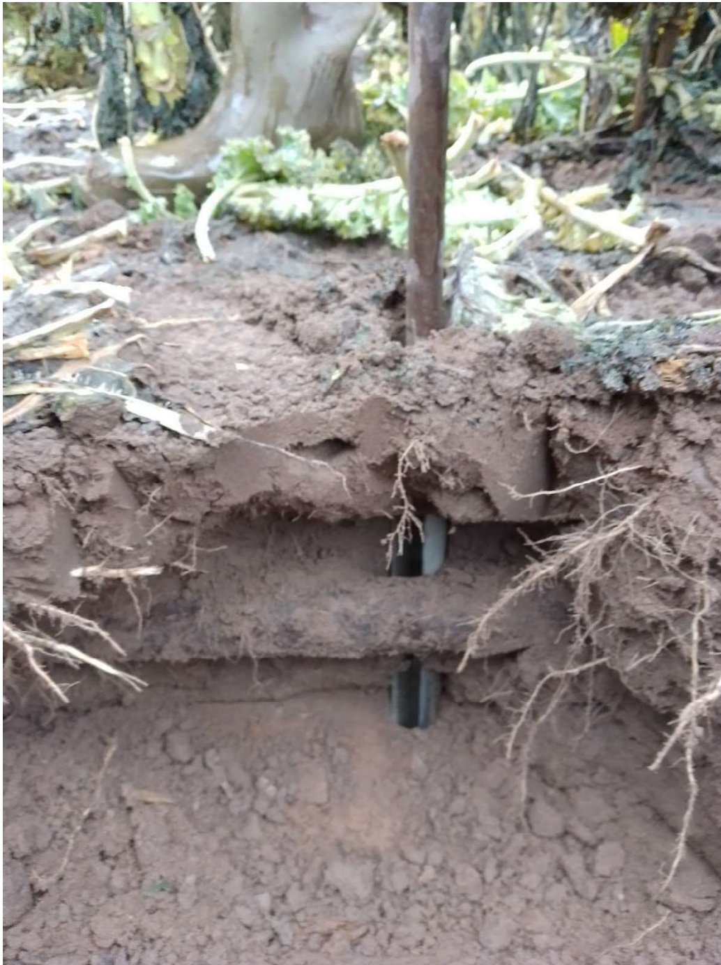
Probe Nmin direkt am Rohr 30-60-90 c