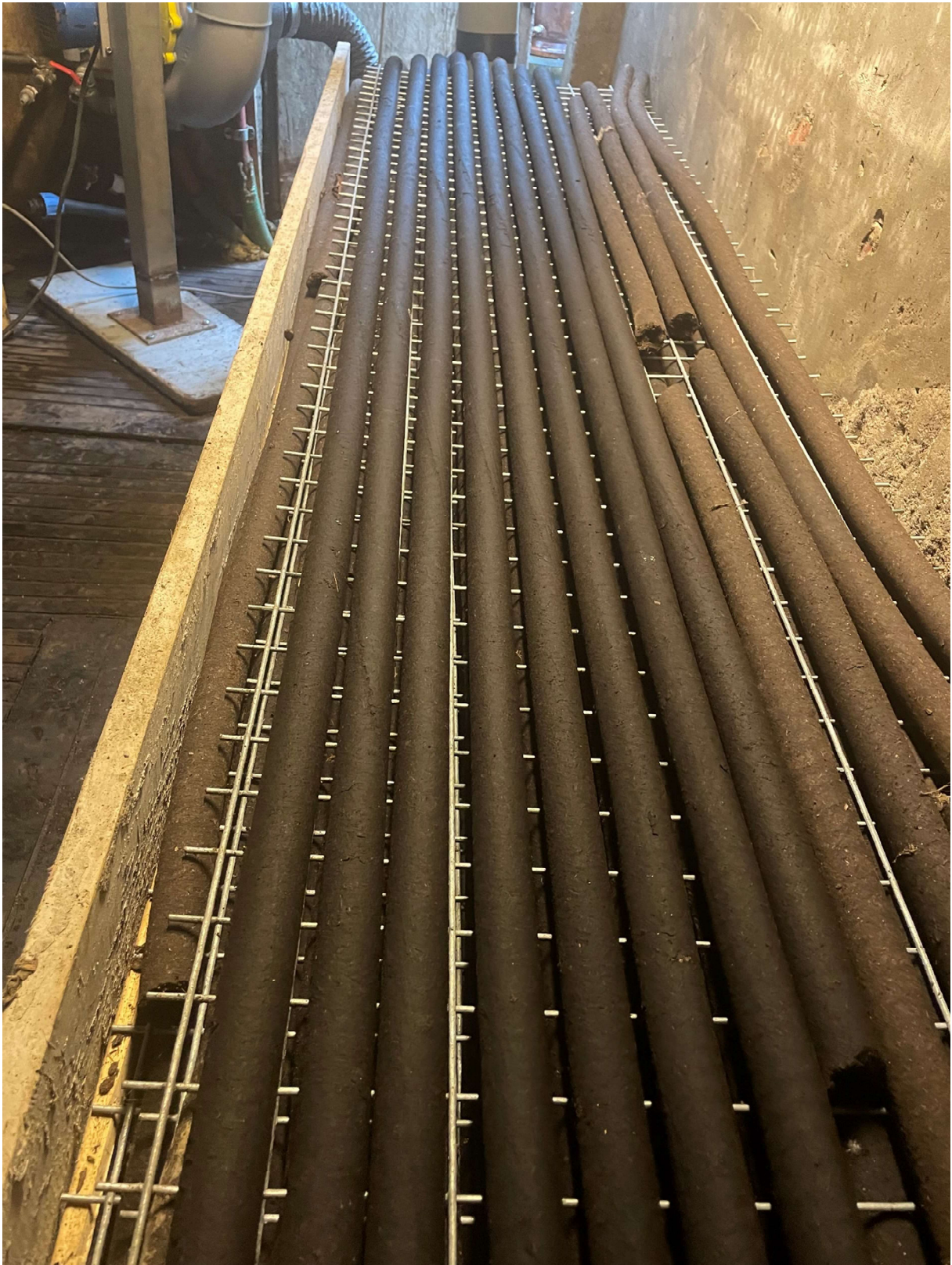
Fertige Rohre, rechts vor dem Umbau und links nach dem Umbau