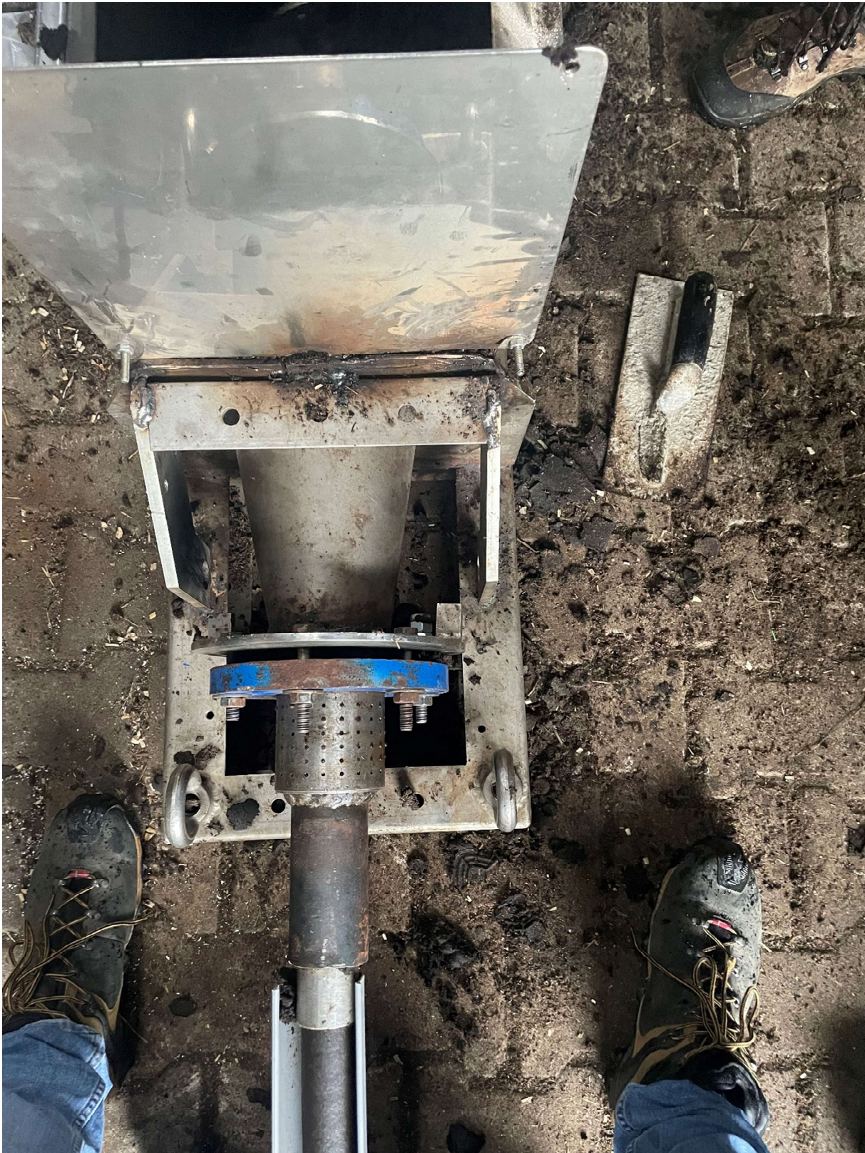
Presse nach Umbau. Rohre kleinerer Durchmesser, kleine Schnecke geht trichterförmig in größere Schnecke über