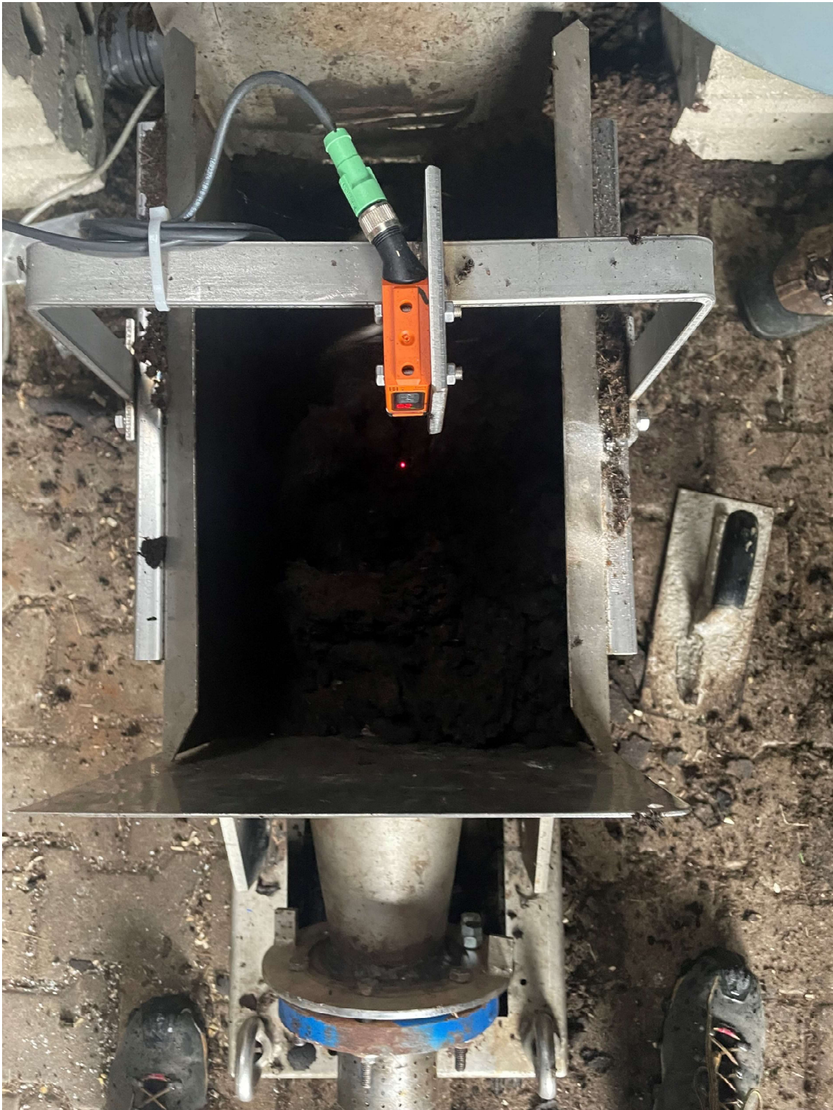
Lichtsensoren zur Steuerung der Zufuhr, überschüssiges Substrat wird aus dem Pressvorgang zurückgedrückt