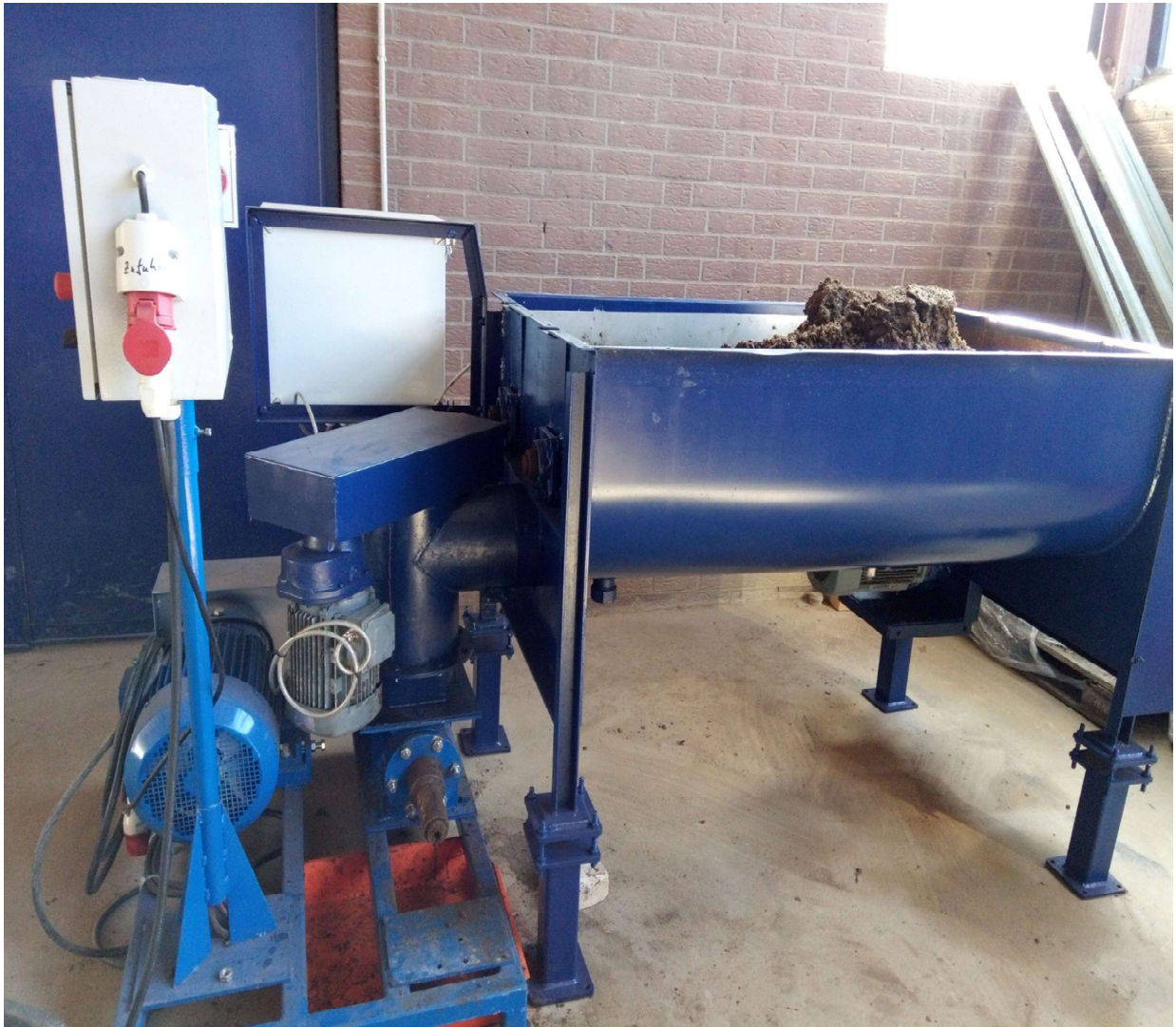
Presse vor dem Umbau