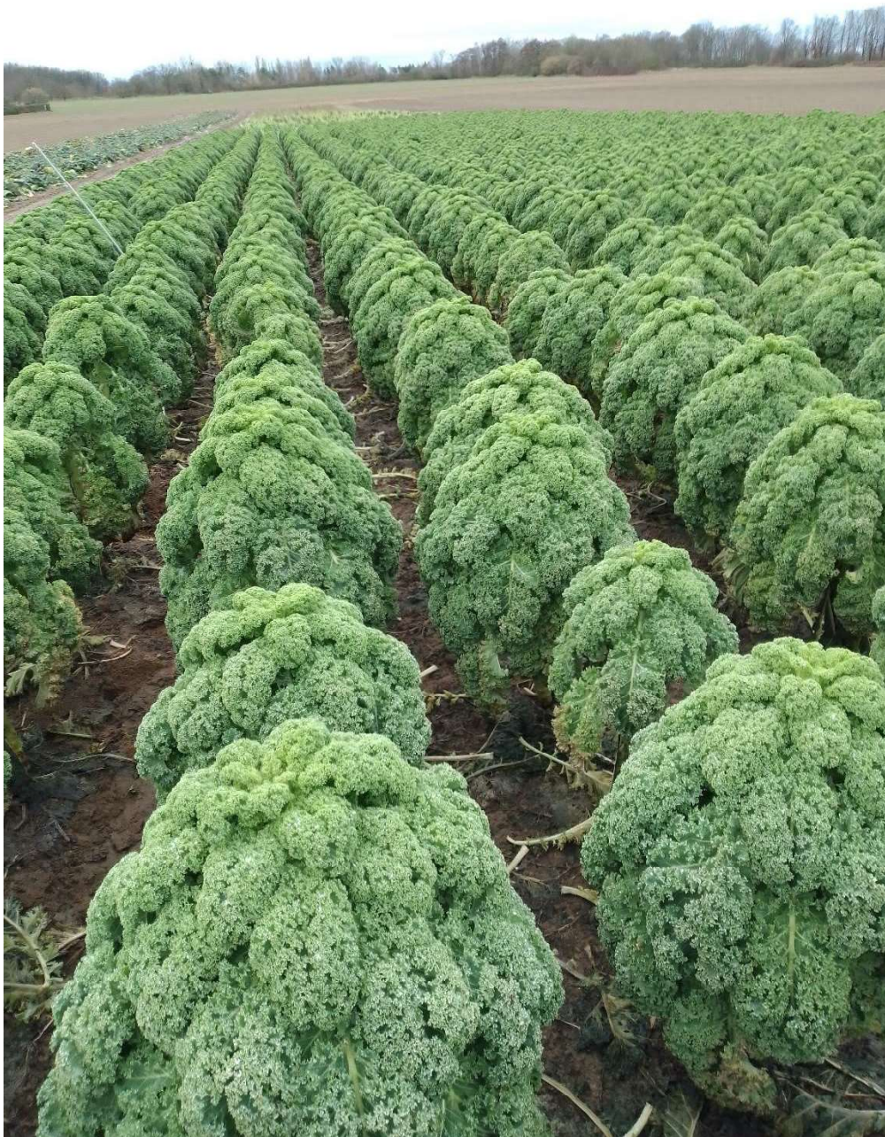
Grünkohl mit 50 m Bewässerungsrohr in der Reihe mit Markierung